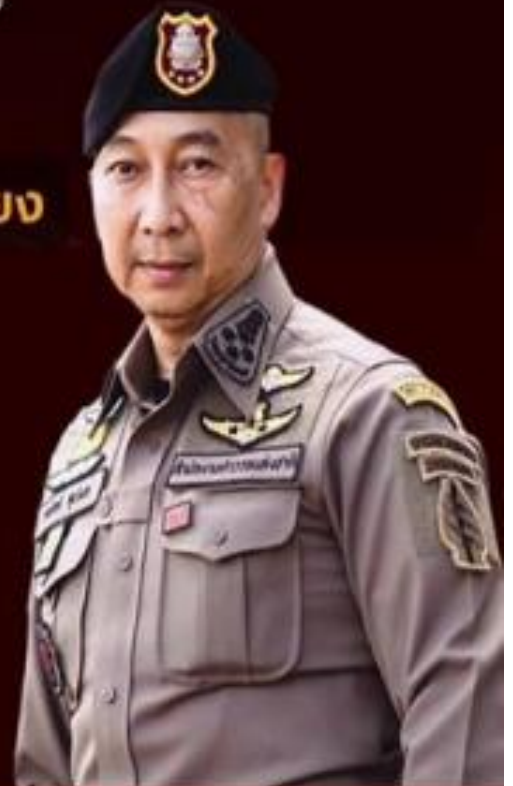
พล.ต.อ.ต่อศักดิ์ สุขวิมล ผู้บัญชาการตำรวจแห่งชาติ

จัดเก็บรักษาข้อมูลจนกว่าคดีถึงที่สุด หรือขาดอายุความ แต่หากระเบียบ